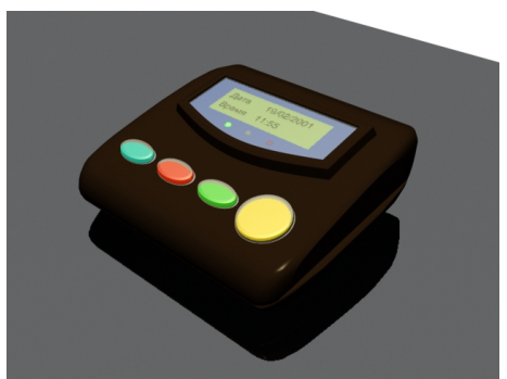
Терминалы оплаты услуг и учёта рабочего времени

В основу системы контроля доступа заложена концепция on-line управления в реальном времени. Она состоит из микропроцессорных модулей-терминалов, подключенных по линиям связи к центральному серверу гостиницы, имеет аппаратный интерфейс связи с системой видео наблюдения, охранной системой и автоматикой здания. Система обеспечивает централизованное управление, мониторинг происходящих событий и состояния модулей системы в режиме реального времени. Система KEI-Biser контролирует и управляет гостиничным комплексом (доступ в комнаты, комфорт, состояние технологических устройств, состояние потребителей электроэнергии и т.д.).