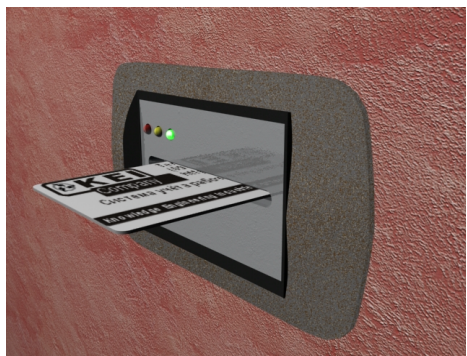
Терминал доступа в помещения